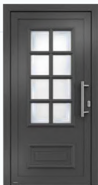
Modell H10878 Hinweis: Nur in Glasfalzfüllung erhältlich. Basisausstattung mit 2-fach Glas. Optional gegen Aufpreis 3-fach Verglasung.

Wir leben im Hier und Jetzt – und schätzen doch die Traditionen. Zu unserem Haus passt nur eine wertsteigernde Haustür im klassischen Stil. Mit eleganter und zeitloser Formensprache. Mit charakteristischen Gestaltungselementen wie Lichtausschnitten oder profilierten Zierleisten. Im Inneren neueste Technik, in der Erscheinung traditionelles Handwerk.